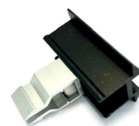
Middenklem zwart 30-35 rail SW 4.1.3.040