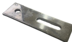
Verbindingsplaatje rail-draadeind SW 4.7.060